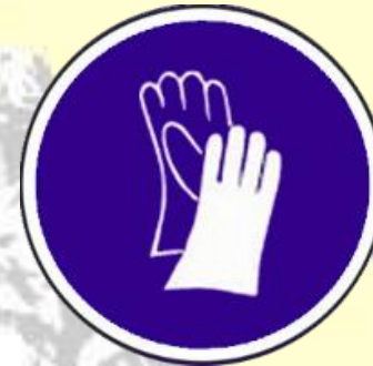
Protección obligatoria de las manos