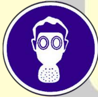
Protección obligatoria de las vías respiratorias