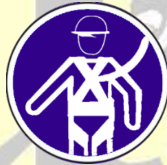
Protección individual obligatoria contra caídas