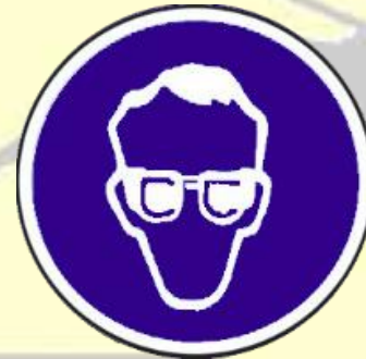
Protección obligatoria de la vista