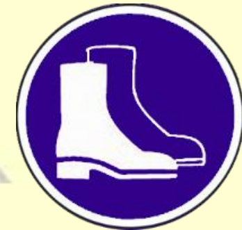
Protección obligatoria de los pies