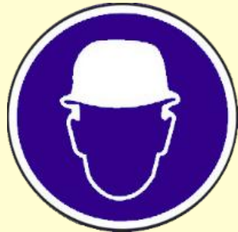
Protección obligatoria de la cabeza