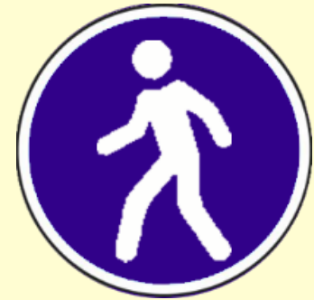
Vía obligatoria Para peatones