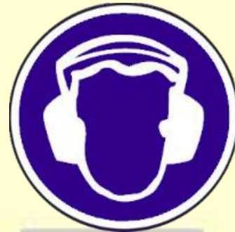
Protección obligatoria del oído